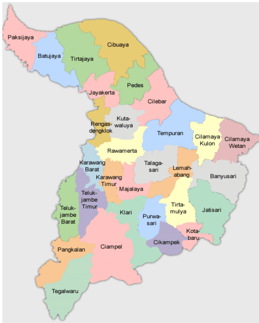
Gambar 2.1 Peta Kabupaten Karawang (52)