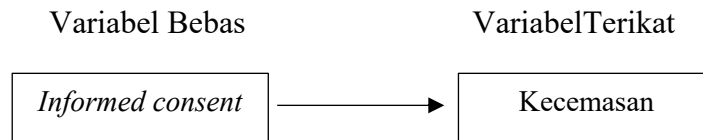
Gambar 2. 5 Kerangka Konsep

Variabel yang dianggap perlu untuk melengkapi hal yang sedang atau akan diteliti dibahas dalam kerangka konsep. Pada penelitian ini, kerangka konsepnya terdiri dari variabel bebas dan variabel terikat sebagai berikut :