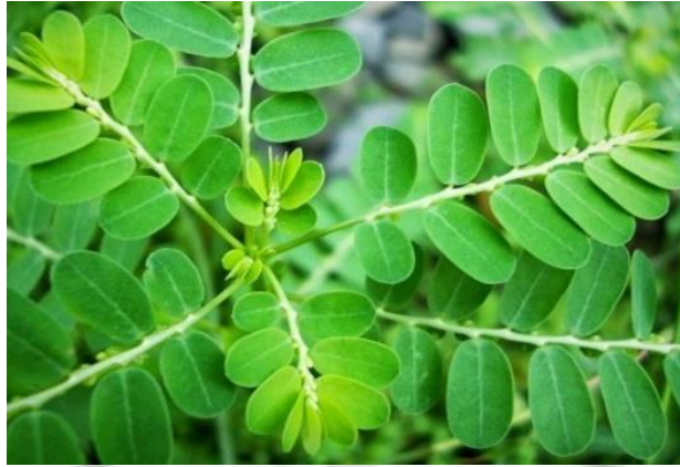
Gambar 1 Daun Kelor. (8)

Di Indonesia tanaman kelor dikenal dengan nama yang berbeda di setiap daerah, di antaranya kelor (Jawa, Sunda, Bali, Lampung), maronggih (Madura), moltong (Flores), keloro (Bugis), ongge (Bima), murong atau barungai (Sumatera) dan hau fo (Timur). (8)