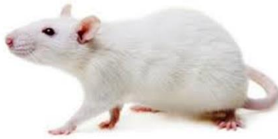
Gambar 3 Tikus Putih (14)