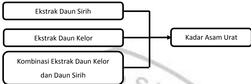
Gambar 5 Kerangka Konsep