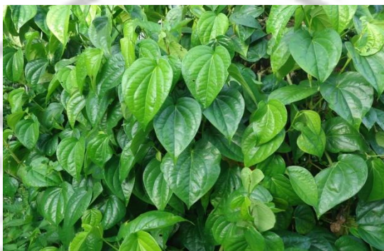
Gambar 2 Daun Sirih (7)

Tumbuhan ini merambat, Panjang rambatan sekitar 20 m. Batang beruas-ruas, beralur, hijau, menggebung pada buku-bukunya, mempunyai akar udara. Daun bervariasi, duduk daun berseling. Tangkai daun 2,5-7 cm. (11)