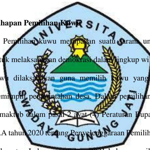
Gambar 2. 1

Pemilihan kuwu merupakan suatu sarana untuk masyarakat desa untuk melaksanakan demokrasi dalam lingkup wilayah desa. Pemilihan kuwu dilaksanakan guna memilih kuwu yang berkewajiban untuk memimpin pemerintahan desa. Dalam pemilihan kuwu, sebagaimana termaktub dalam pasal 2 ayat (4) Peraturan Bupati Indramayu Nomor 64.A tahun 2020 tentang Penyelenggaraan Pemilihan Kuwu Serentak Di Kabupaten Indramayu Tahun 2021 bahwa pemilihan kuwu melalui 4 (empat) tahapan, sebagai berikut: