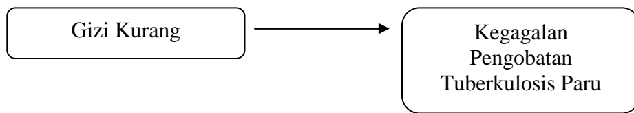
(Gambar 2. Kerangka Konsep)