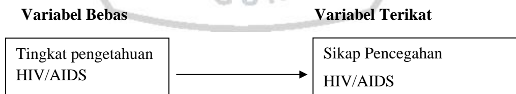
Gambar 2. Kerangka Konsep