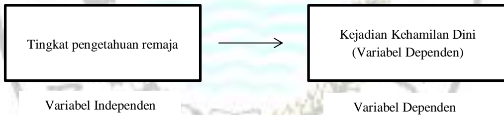
Gambar 2. Kerangka Konsep