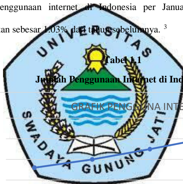
Tabel 1.1 Jumlah Penggunaan Internet di Indonesia

modern 2 . Sederhananya, bisnis financial technology menggabungkan bidang jasa keuangan dengan teknologi. Bisa juga diartikan sebagai segmen pada perusahaan startup yang dapat menyokong, memaksimalkan pemakaian teknologi guna mempertajam, mengubah, dan mempercepat berbagai aspek pelayanan keuangan. Sehingga, mulai dari metode pembayaran, transfer dana, pinjaman, pengumpulan dana, sampai dengan pengelolaan aset dapat dilaksanakan lebih efisien, cepat, dan mudah akibat dari penggunaan teknologi yang sudah modern. Hasil survei menurut data yang diambil dari: we are social , penggunaan internet di Indonesia per Januari 2022 mengalami peningkatan sebesar 1.03% dari tahun sebelumnya. 3