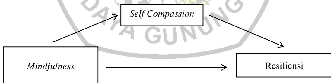
Gambar 2. Kerangka Konsep