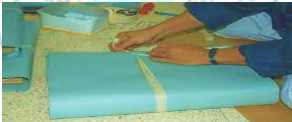
Gambar 2.3 Penggunaan Sampul

Manuver fisik adalah proses penggabungan arsip sesuai dengan nomor definitif pada kartu deskripsi, selanjutnya dilakukan pemberian nomor pada arsip. Sebaiknya, pemberian nomor definitif arsip dilakukan di sudut kanan atas pada sampul pembungkus arsip. Nomor definitif arsip ini sebagai nomor pengenal arsip ketika disimpan di ruangan/depo arsip pada lembaga kearsipan. Contoh penggunaan sampul pembungkus arsip seperti dibawah ini.