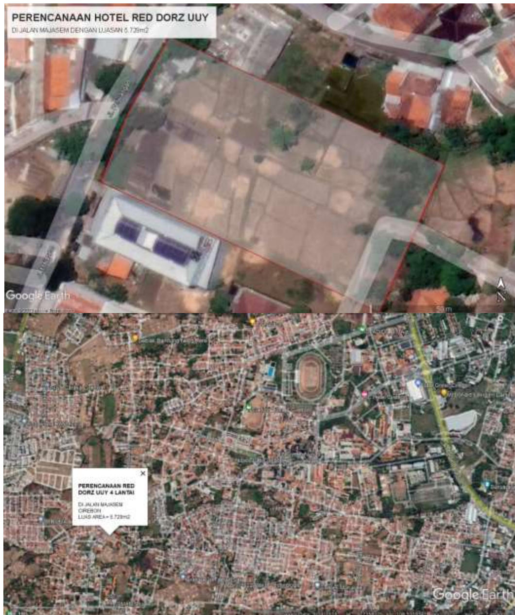
Gambar 3.1 Lokasi Daerah Penelitian dari Citra Satelit

Perencanaan ini berlokasi jalan Majasem kelurahan Karyamulya Kota Cirebon.