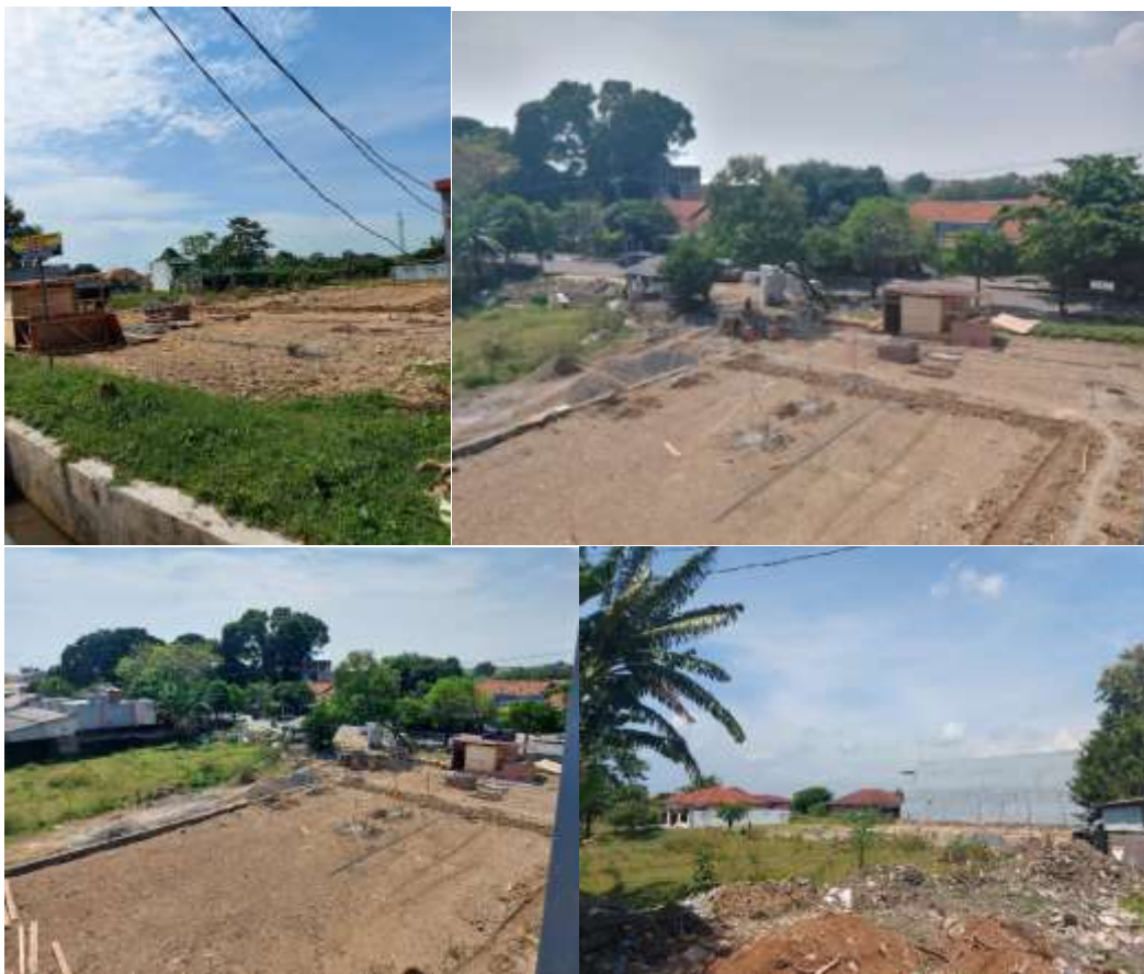
Gambar 3.2 Lokasi Daerah Penelitian