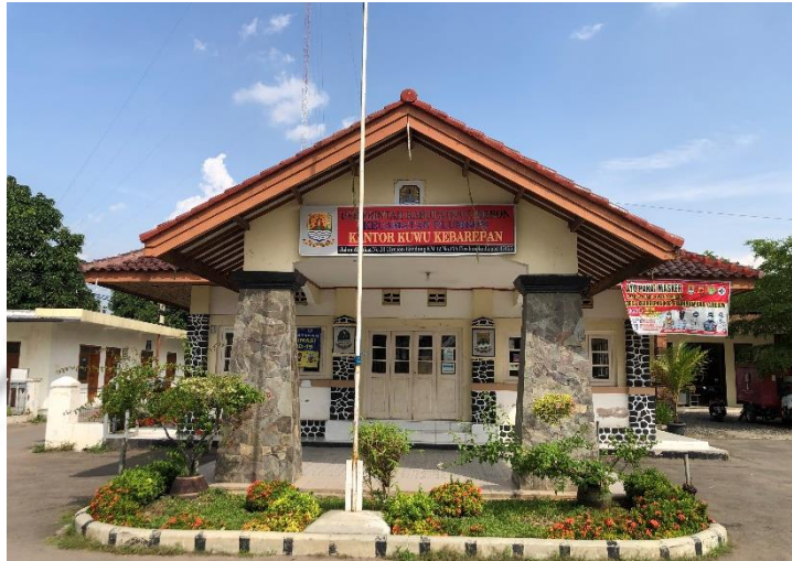
Gambar 2. Kantor Desa Kebarepan Kecamatan Plumbon Kabupaten Cirebon