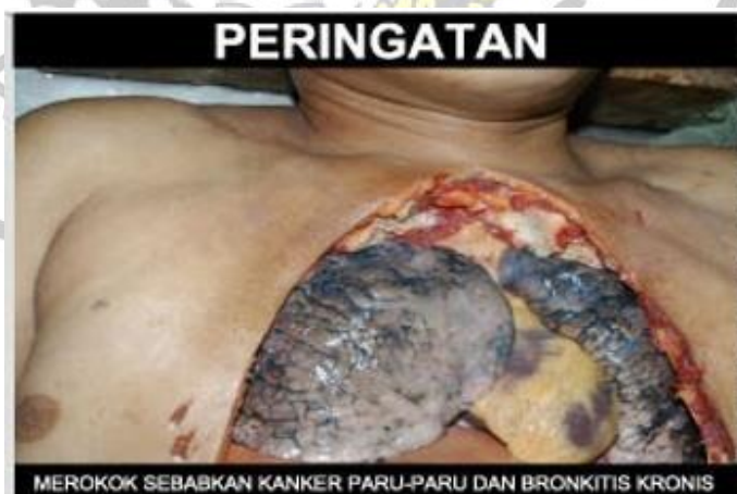
Gambar 6 Paru-paru menghitam karena kanker