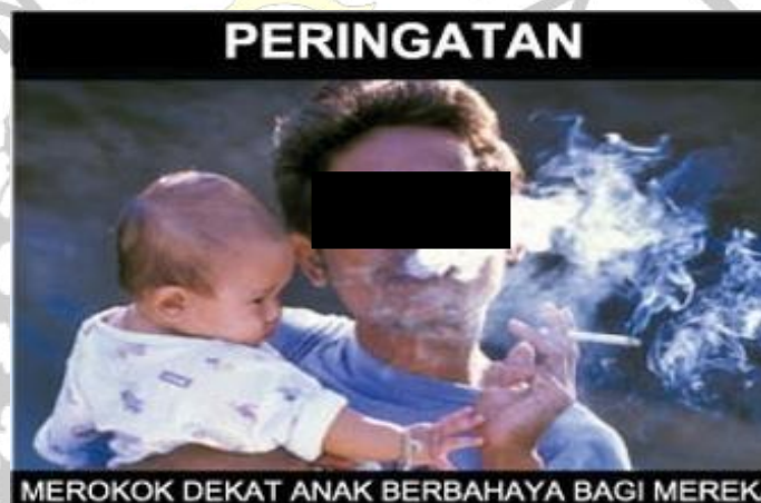
Gambar 2 Orang merokok dengan anak di dekatnya

Jenis-jenis peringatan bahaya merokok antara lain berupa: