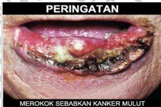
Gambar 5 Kanker mulut