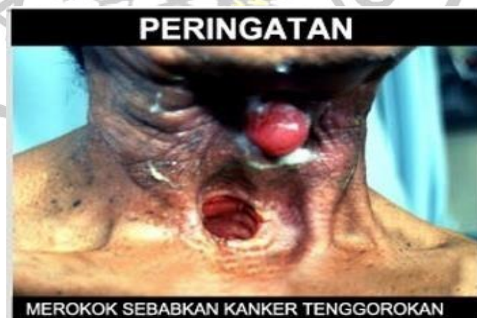
Gambar 3 Kanker tenggorokan