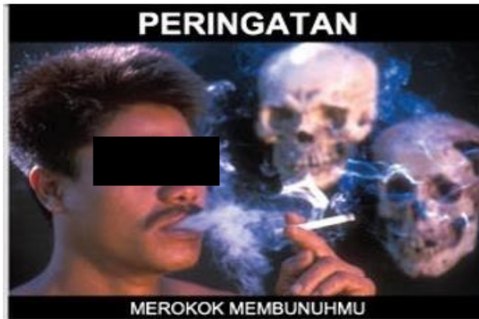
Gambar 4 Perokok dengan asap yang membentuk tengkorak